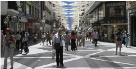
¿Qué tenemos? Mercados amigables y accesibles