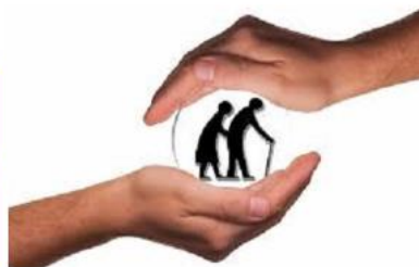
Cuidar a quienes cuidan