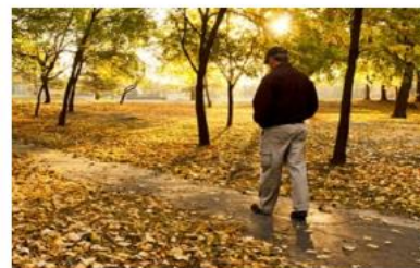
Soledad en las personas mayores