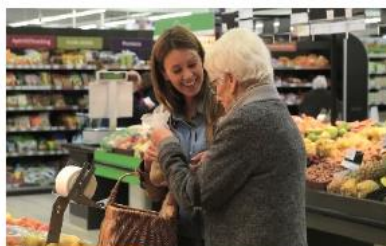
Establecimientos amigables con las personas mayores