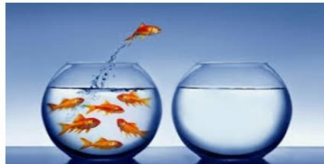
¿Te atreves a cambiar hacia un comercio amigable con las personas mayores?

Madrid Ciudad amigable con las personas mayores