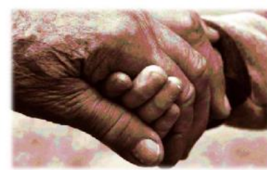
Madrid sigue luchando contra el Alzheimer