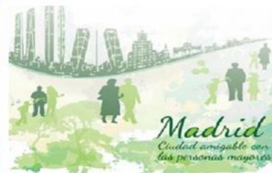
Madrid, ciudad amigable con las personas mayores