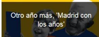
Otro año más, 'Madrid con los años'