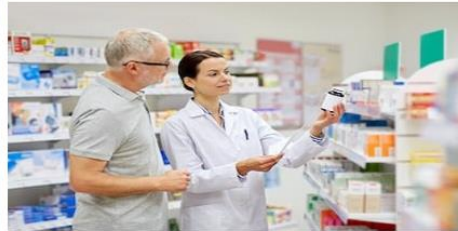
Atendiendo a la pluralidad: prácticas amigables