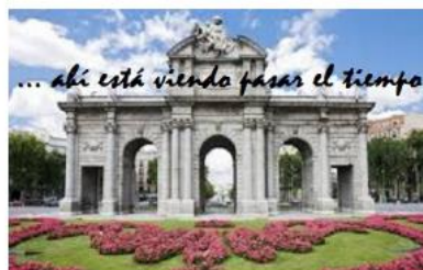
Jornadas 2019 'ENVEJECER EN MADRID'